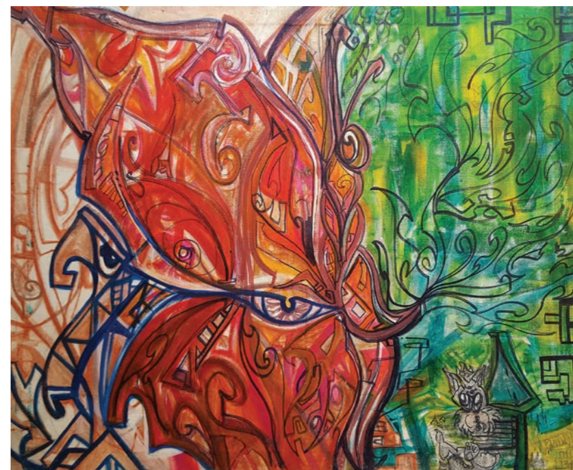
1 TEORÍA DEL CAOS, ATRÉVETE Y BATE TUS ALAS 80x110 Acrílico

El autor reconoce que todo el caos adictivo tiene su patrón de conducta y anima a salir de este patrón con la metáfora del batir de las alas de mariposa. Este caos representado por una cabeza de jabalí a la izquierda del cuadro (el lado oscuro de la adicción). En la parte central hay media cara de persona semi-escondida como metáfora de cómo queda camuflado el lado personal en una adicción.