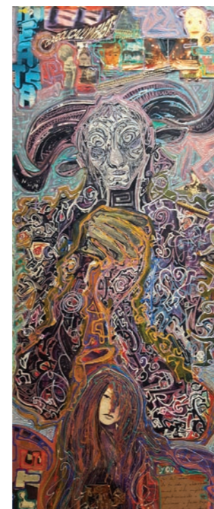
2 SUEÑO DE UNA NOCHE DE VERANO 40x110 Acrílico-Collage

Y por último se ve la mariposa que está batiendo sus alas y despega de su estatis-mo dejando atado al adicto representado por un gato atado a un cohete.